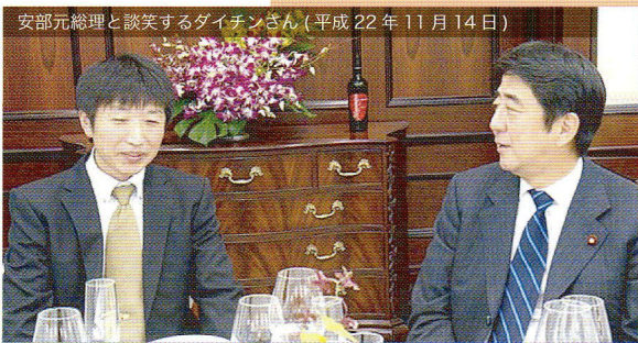
安部元総理と談笑するダイチンさん(平成22年11月14日)